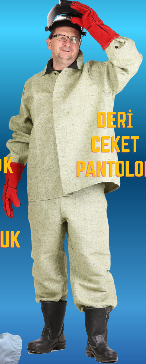
DERİ CEKET PANTOLON