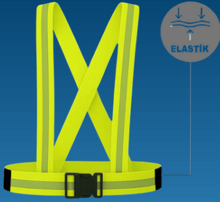
EKO PRATİK ŞERİT YELEK

İKİ RENKLİ MÜHENDİS İKAZ YELEĞİ CEPLİ FERMUARLI