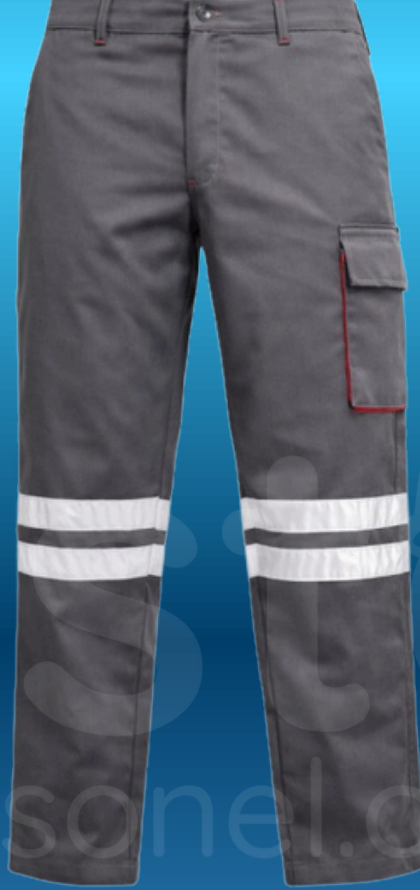
HARMAN KARIřIM LİKRALI PANTOLON