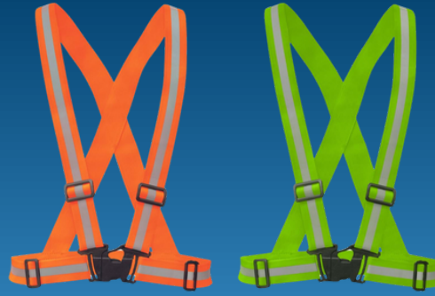
PRATİK ŞERİT YELEK