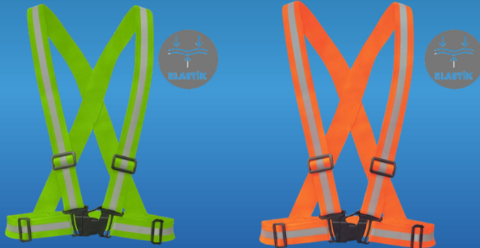
ELASTİK PRATİK ŞERİT YELEK